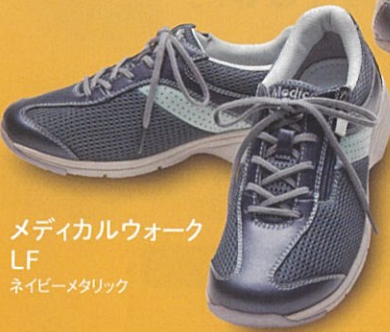
メディカルウォーク LF ネイビーメタリック