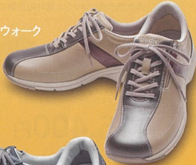
メディカルウォーク MS-L オークコンビ